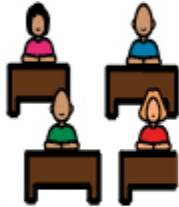
IN CLASSE CON I COMPAGNI