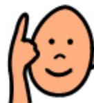
E IO CAPISCONO COSA MI DICONO