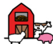
QUANDO VADO IN CASCINA A VEDERE