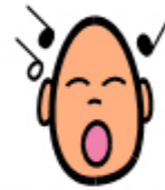
QUANDO SENTO CANTARE