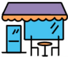
QUANDO VADO AL BAR A BERE