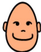
MA SONO FELICE ANCHE QUANDO