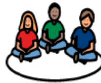
QUANDO STIAMO INSIEME