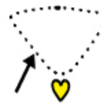
MI METTO LA COLLANA