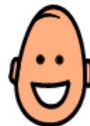
E SONO FELICE QUANDO